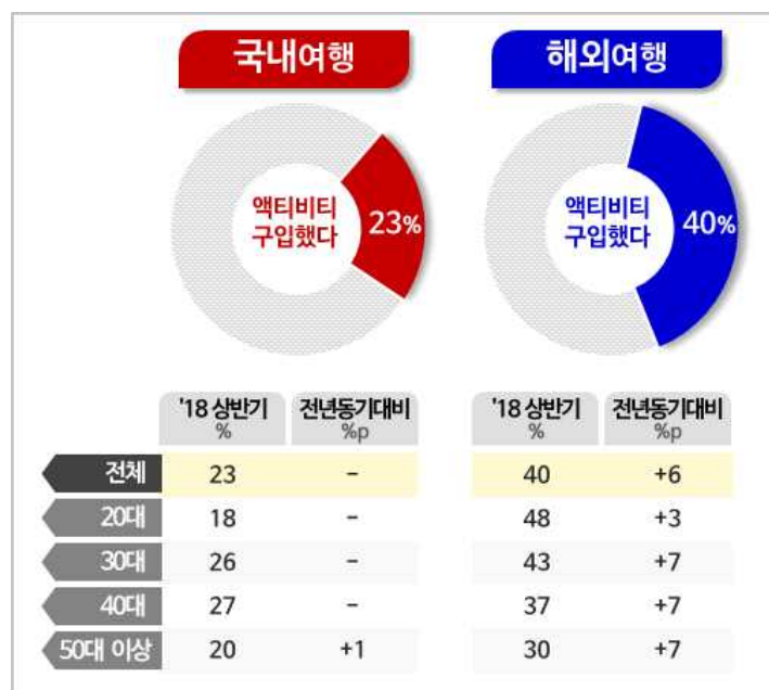
[그림1] 국내-해외여행시 액티비티 구입율

세종대학교 관광산업연구소와 여행전문 리서치 기관 컨슈머인사이트가 공동 수행하는 ‘주례 여행 형태 및 계획 조사’(매주 500명, 연간 2만6천명 조사)에 따르면 ▲'18년 상반기에 개별 여행객의 입장권, 레저/투어 상품 등 액티비티 구입경험은 국내 23%, 해외 40%였다. 해외가 국내의 두 배 가까웠다[그림1].